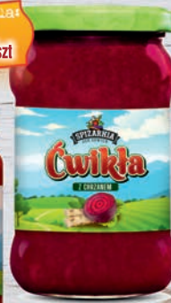
Cwikła z chrzanem 315 ml