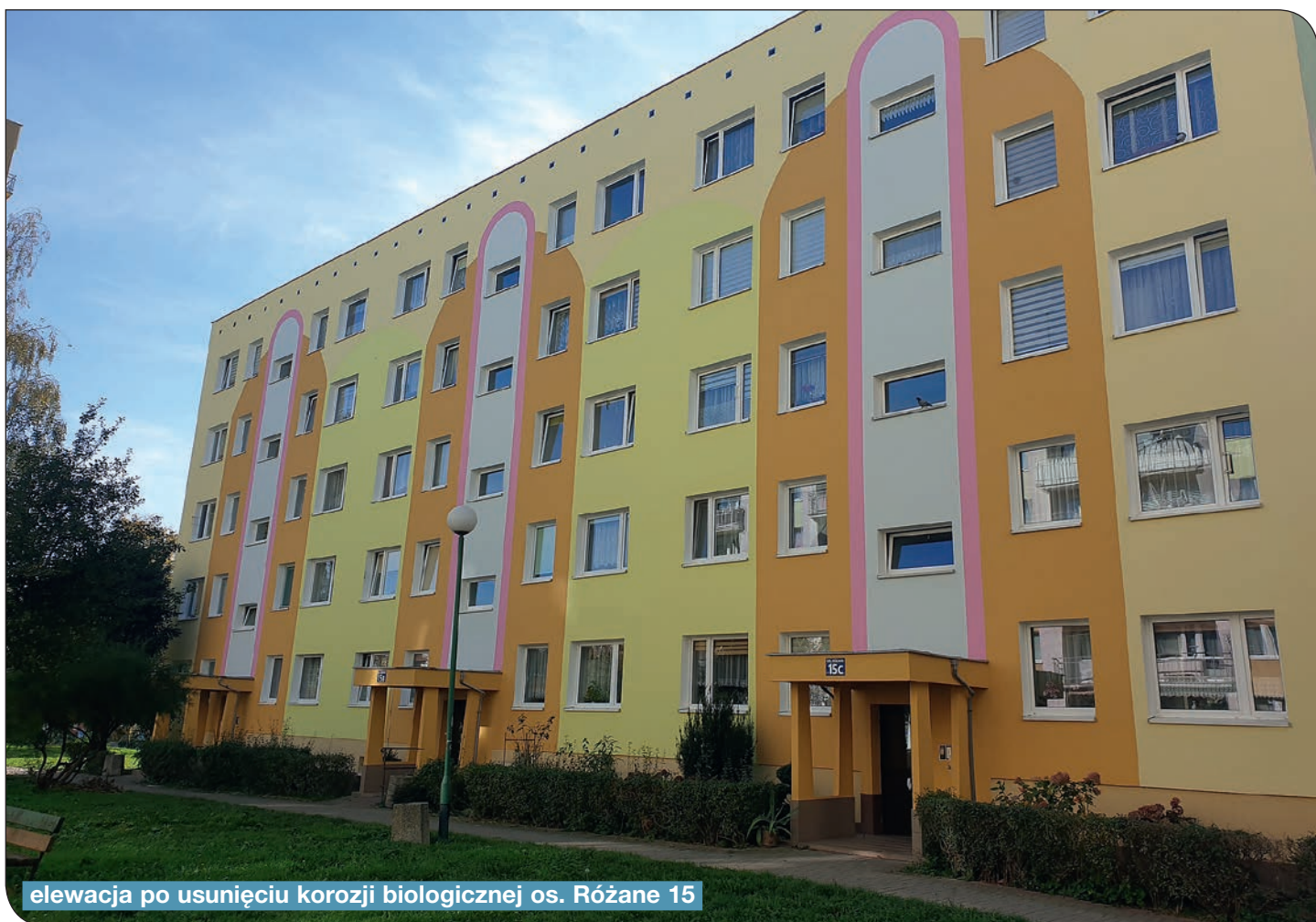
elewacja po usunięciu korozji biologicznej os. Różane 15