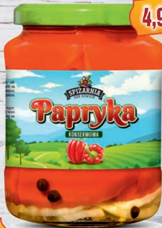
Papryka konserwowa 720 ml