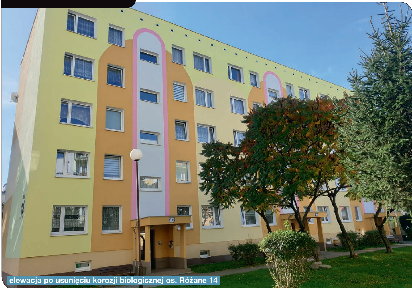
elewacja po usunięciu korozji biologicznej os. Różane 14