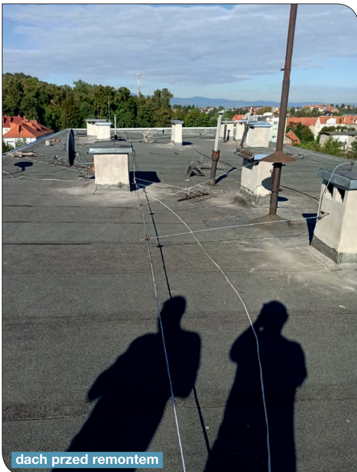
dach przed remontem