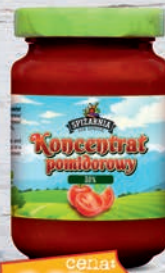
Koncentrat pomidorowy 190 ml