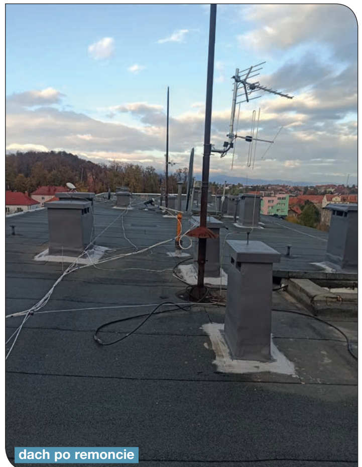
dach po remoncie